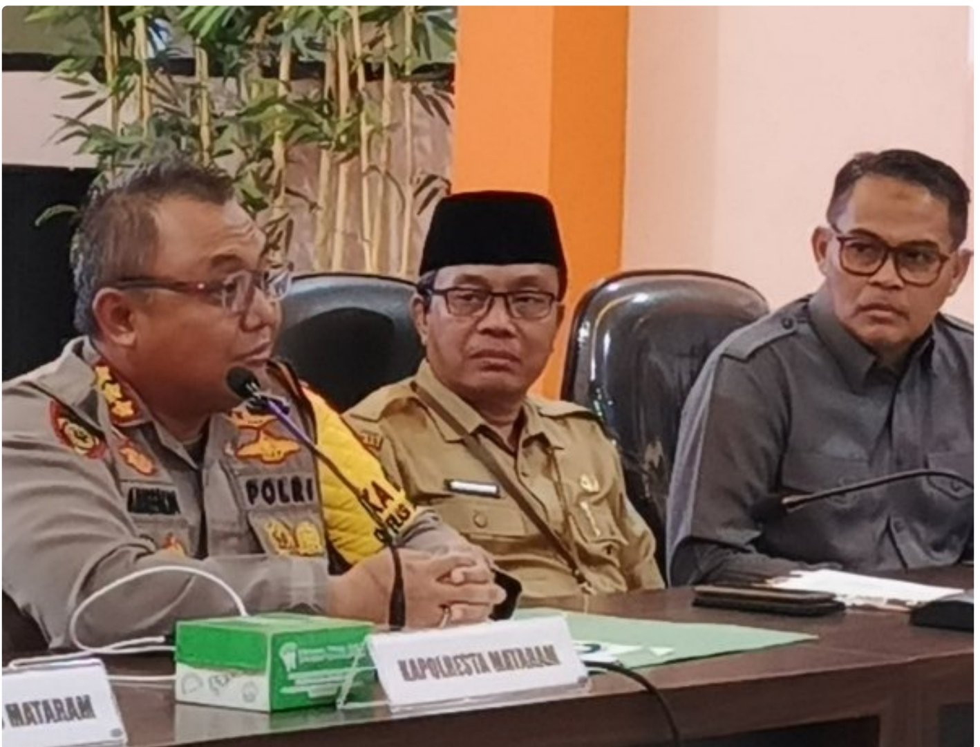
Kapolresta Mataram (Kiri) saat memimpin Konferensi pers akhir tahun, Selagi (31/12/2024)

MATARAM, NTB – Polresta Mataram mengakhiri tahun 2024 dengan menggelar Konferensi Pers Akhir Tahun, sebuah forum transparansi untuk memaparkan capaian dan inovasi yang telah dilakukan selama satu tahun. Kegiatan yang berlangsung di Gedung Wira Pratama Polresta Mataram ini dipimpin langsung